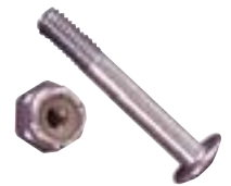
Universal Schraube passend für alle Figuren mit 16 mm Stangendurchmesser Art. 492046 Schraube mit Mutter € 0,50