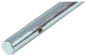
Kickerstangen aus hochwertigem, kalt gezogenem Stahl (1000 N/mm 2 ). Durchmesser 16 mm massiv, Verchromung 15 Mikron.