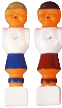
Spieler für Sportschau-Kicker 16 mm Stangendurchmesser Art. 492017 blau € 2,50 Art. 492018 rot € 2,50