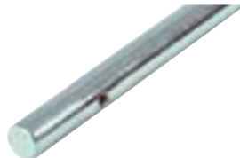
Kickerstangen 13 mm massiv, für Modell Flame