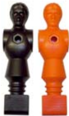
Spieler „Nelson-Germany“ Super Turnierspieler für Silverstar 16 mm Stangendurchmesser