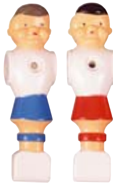
Spieler für Flame 13 mm Stangendurchmesser Art. 492015 blau € 2,00 Art. 492016 rot € 2,00