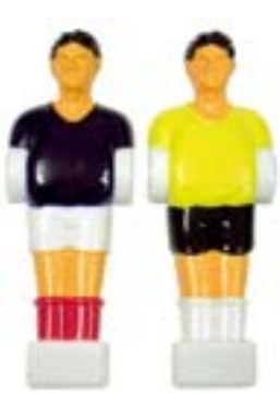
Spieler für Mini Cup 13 mm Stangendurchmesser Art. 492012 blau € 1,50 Art. 492013 gelb € 1,50