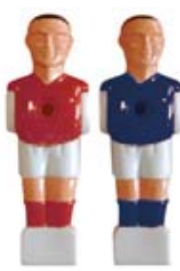
Spieler „Europe“ für Playtime-Kicker 16 mm Stangendurchmesser