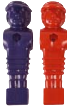
Spieler für Master Cup 16 mm Stangendurchmesser Art. 492001 blau € 2,50 Art. 492003 rot € 2,50