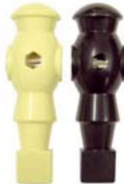
Spieler für Pro Cup 16 mm Stangendurchmesser Art. 492010 weiß € 2,50 Art. 492011 schwarz € 2,50