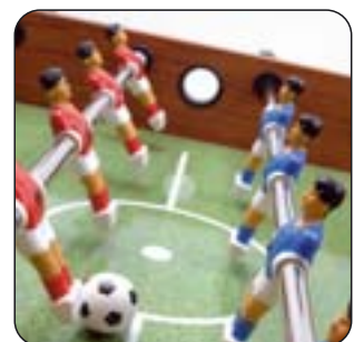
Spielfeld in „Rasenoptik“